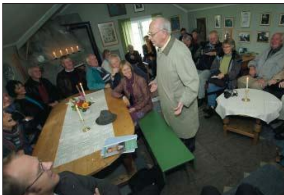
TIDLIGERE: Det har vært folksomt i Tørkhuset ved tidligere åpne dager. Her fra 2005.